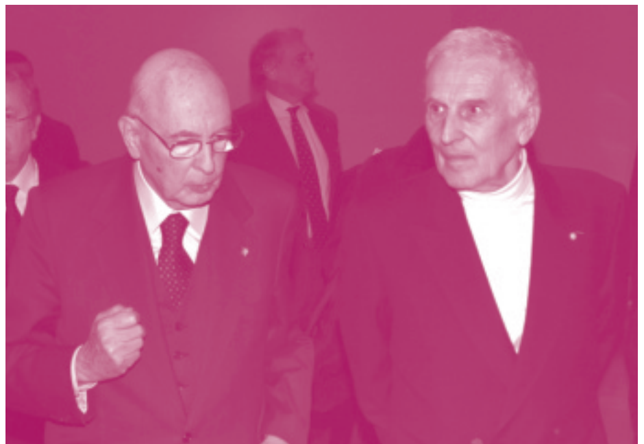
Il Presidente della Repubblica Giorgio Napolitano e il Professor Silvio Garattini

Un gruppo di 20 persone lasciò l'Università per iniziare una straordinaria avventura; nasceva così una specie di